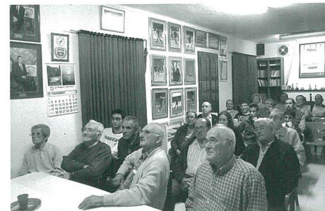
Pendants del partit al local social