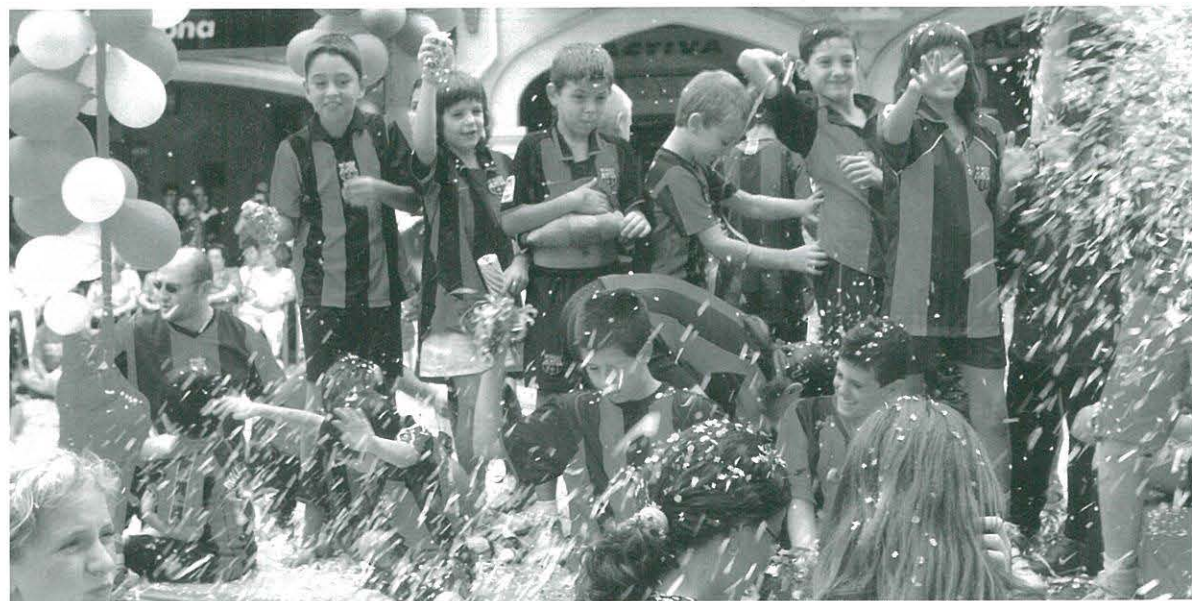
Els nens a la carrossa