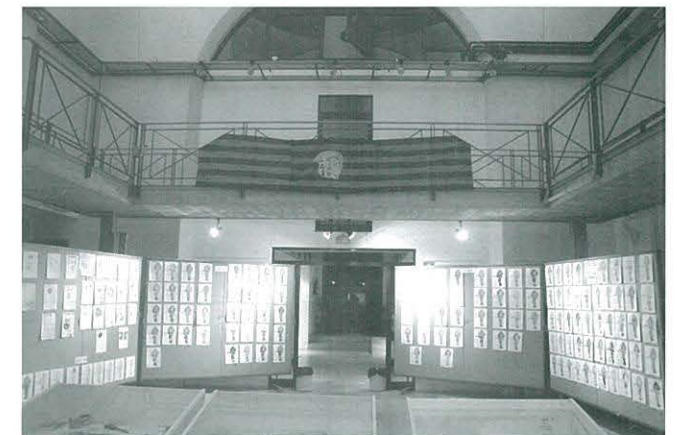
Exposició del Concurs "Fem Barça"