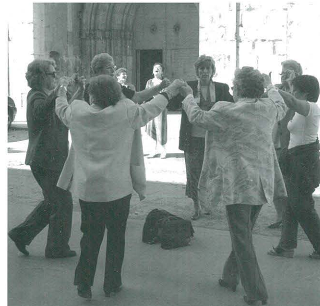
Ballada de Sardanes