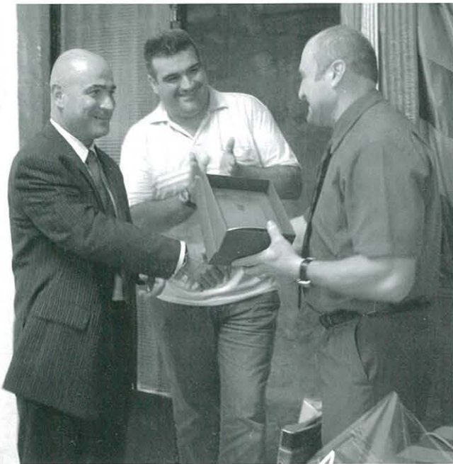
Intercanvi obsequis Barça-Penya