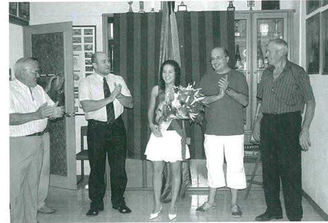
Nomenament Pubilla 2005