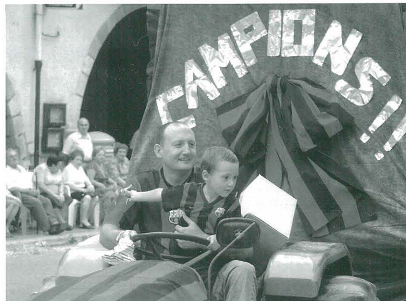
El nostre xofer